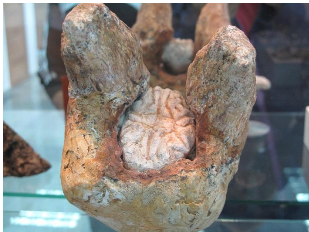
Вкаменен череп на газела с фосилизиран мозък